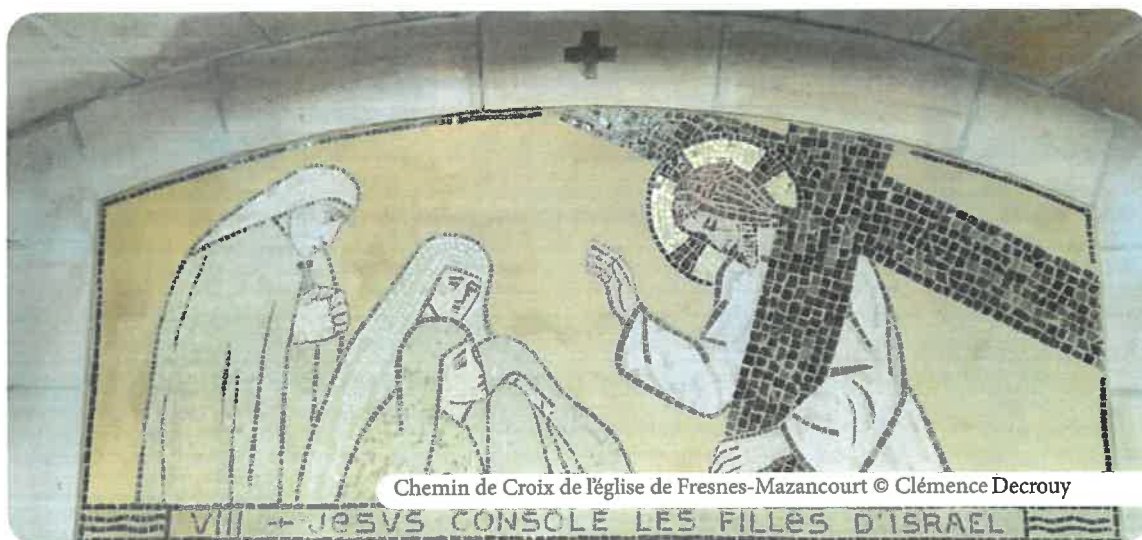
Chemin de Croix de l'église de Fresnes-Mazancourt

Gratuit sur réservation. Limité à 9 personnes