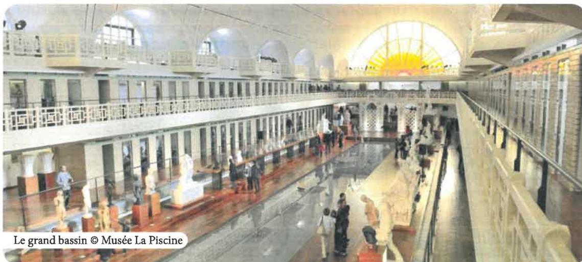
Le grand bassin

Rdv : Médiathèque-La Grand Plage de Roubaix Gratuit