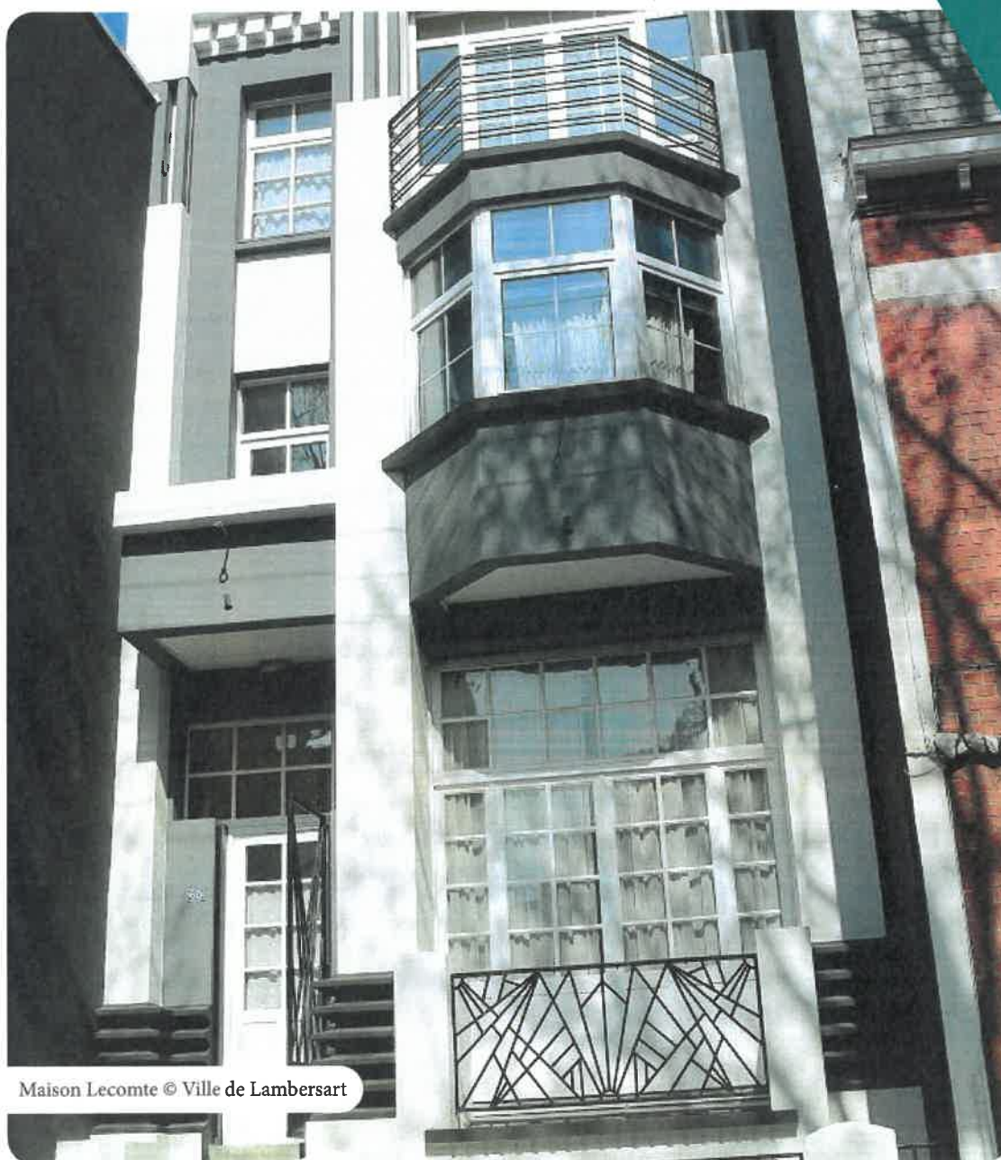
Maison Lecomte

Vous pourrez prolonger cette exposition sur www.lambersart.fr et par QR-codes à flasher sur les panneaux de l'exposition.