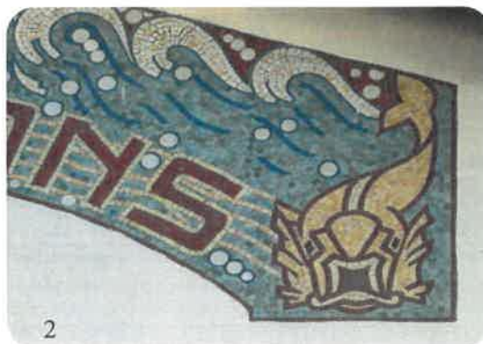
1 - Église Notre-Dame de Chauny © É. Boutigny 2 - Halle aux poissons de Chauny © Anne Richard