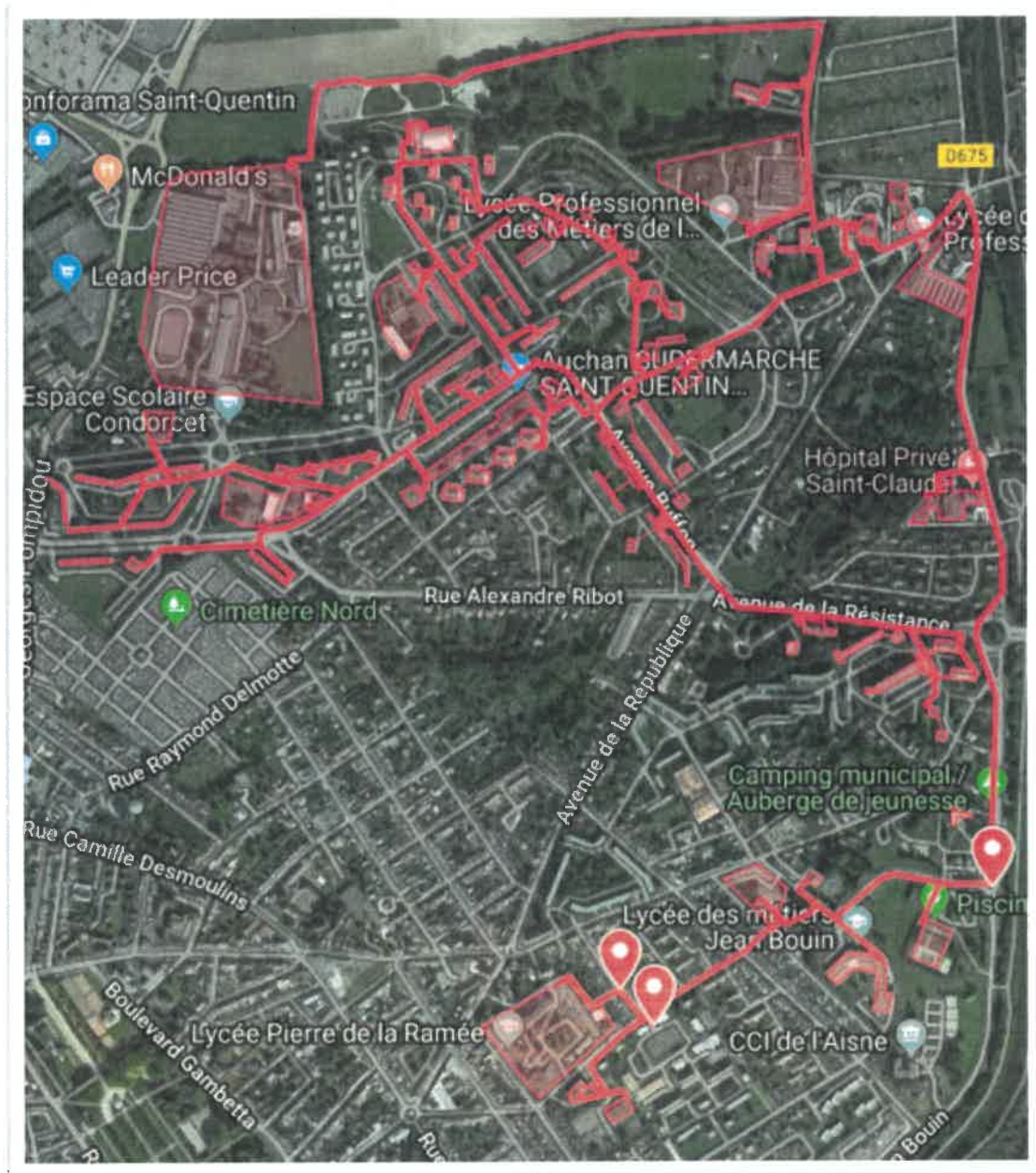
Extraction Google Maps – Réseau existant (rouge)