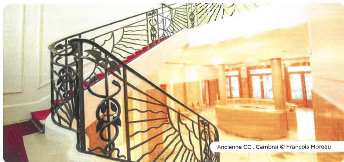
Ancienne CCI, Cambrai

Tarif : (droit d'entrée) 3€. Réservation obligatoire : 03 27 76 29 77