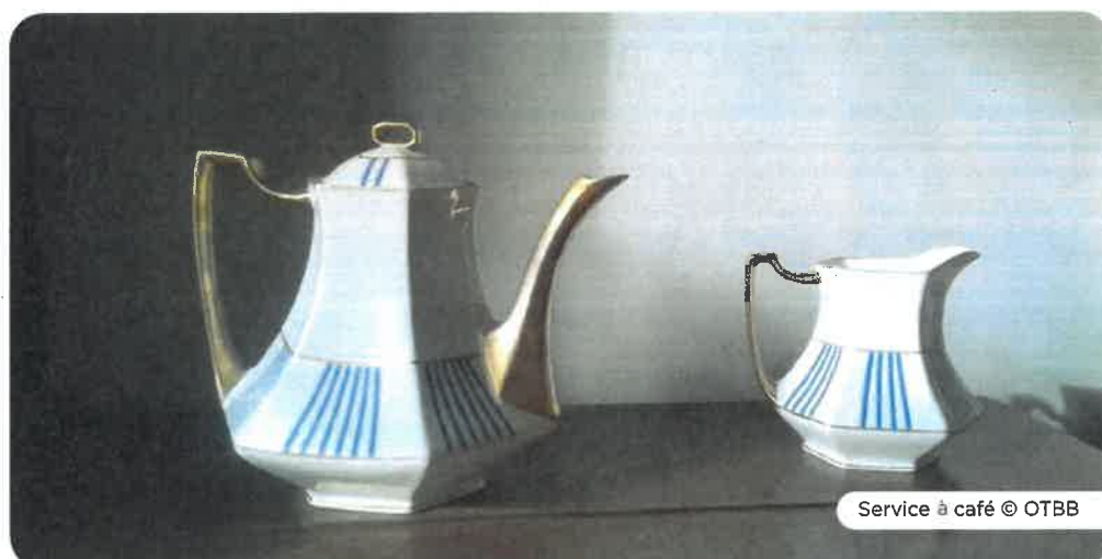
Service à café