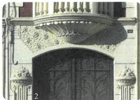
1 - La Criée municipale © F. Pillet 2 - Rue de Baudreuil © F. Pillet