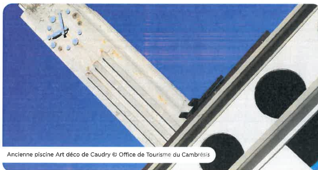
Ancienne piscine Art déco de Caudry

Où : facebook.com/cambraitourisme , www.tourisme-cambresis.fr