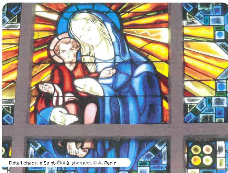
Détail chapelle Saint-Éloi à Isbergues © A. Penin