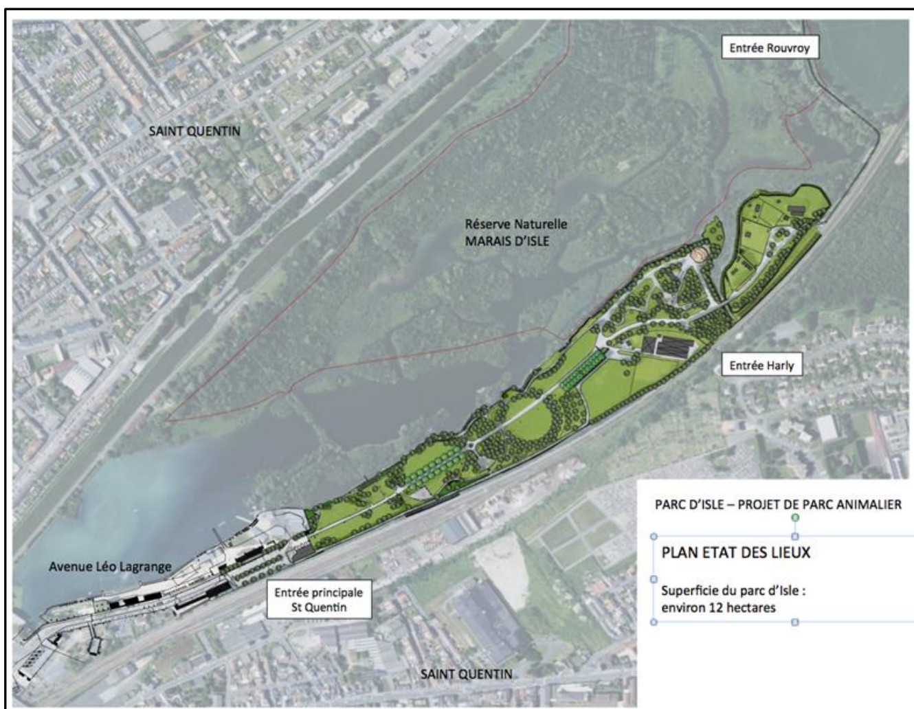
Carte 1 : Plan du parc actuel

L'établissement bénéficie de l'autorisation d'ouverture d'un établissement fixe de présentation au public d'animaux d'espèces non domestiques N°FSC/AO/2016/03 du 1 er mars 2016.