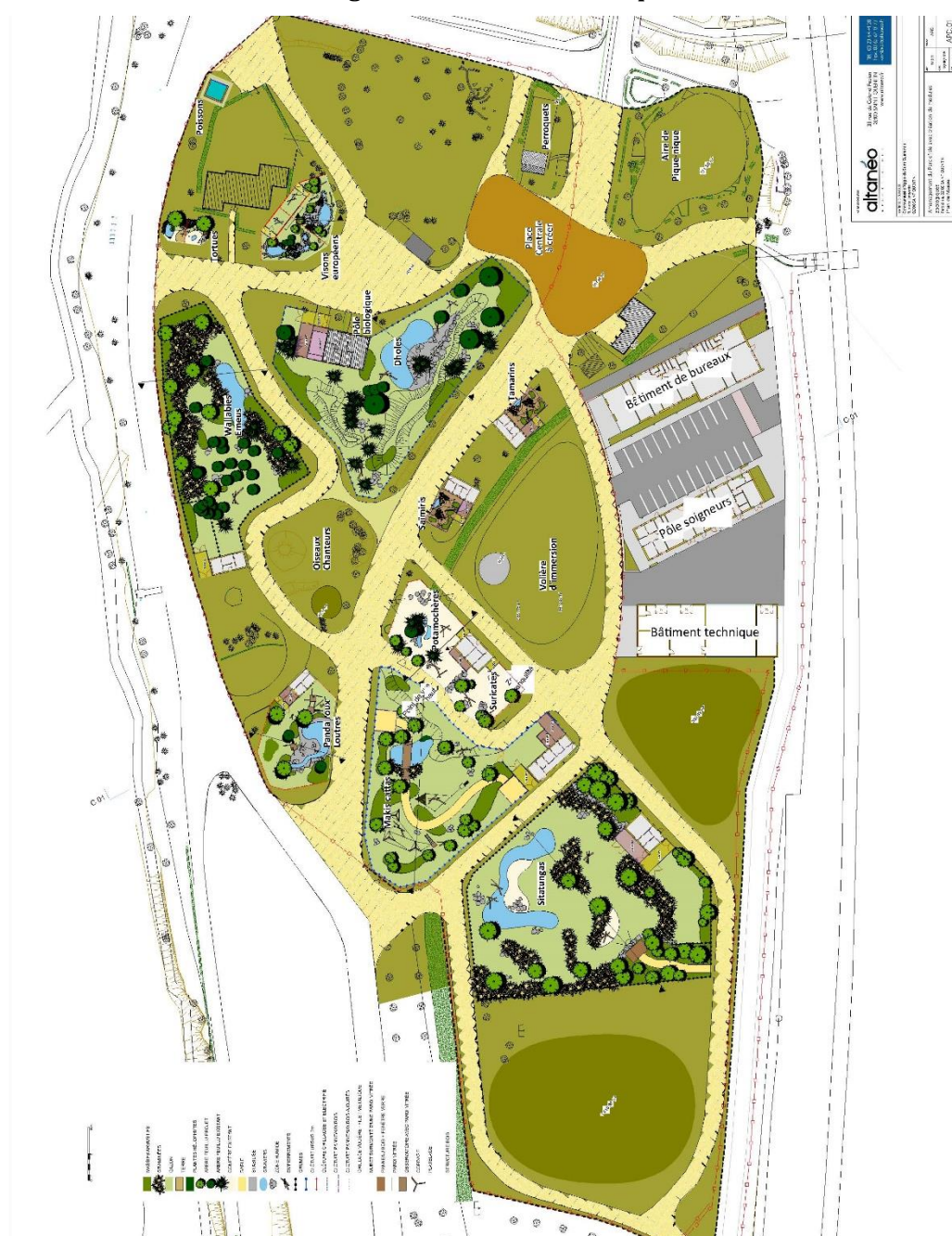
Carte 4 : Aménagement de l'extension du parc animalier

Le projet comprend également la zone technique nécessaire à la gestion des animaux (vétérinaire, chambres froides, stockage aliments...)